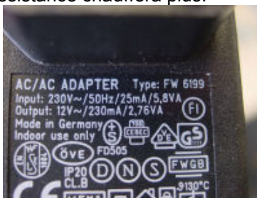
Transfo alternatif (AC)

Attention, ne faites pas de court-circuits sur le transfo. S'il a un fusible, vous serez embêté pour le changer. S'il n'en a pas, un fil va fondre quelquepart, et cela a peu de chance d'être réparable. Faites un câblage propre jusqu'à la résistance. Après, si la diode est court-circuitée, elle va s'éteindre et la résistance chauffera plus.