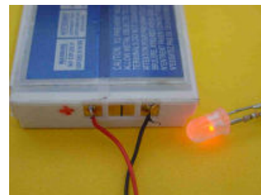
Récupération d'un accu « foutu »