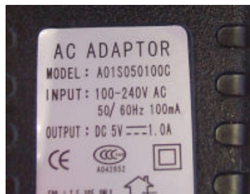
Tranfo redressé. Le + est au centre du jack