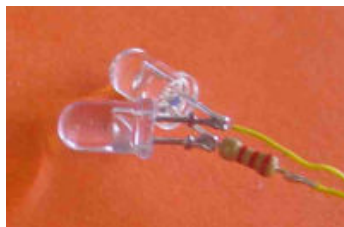
Deux LEDs en série pour une tension > 4.5V